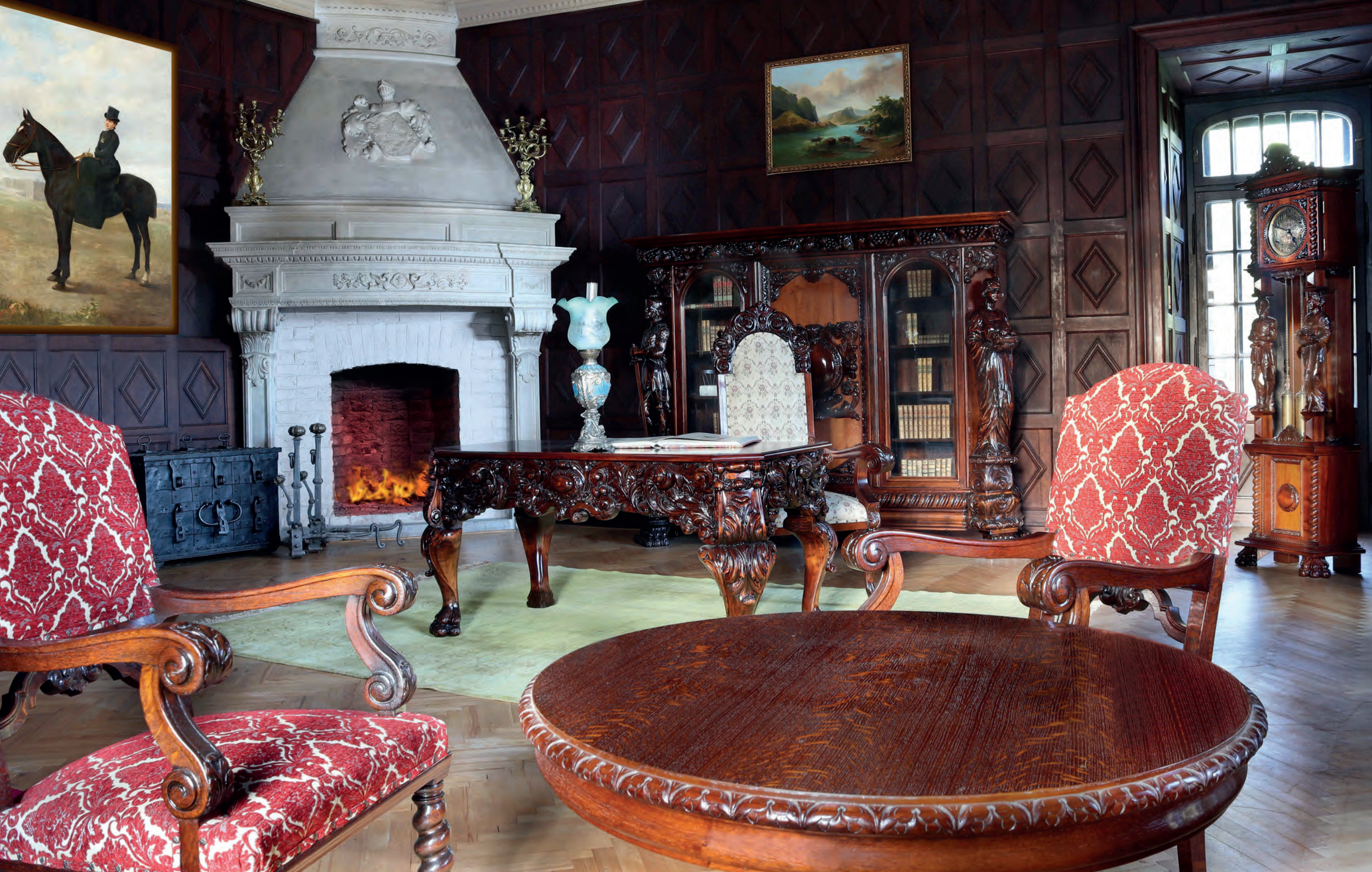
Renesančná pracovňa v pánskom krídle kaštiela.