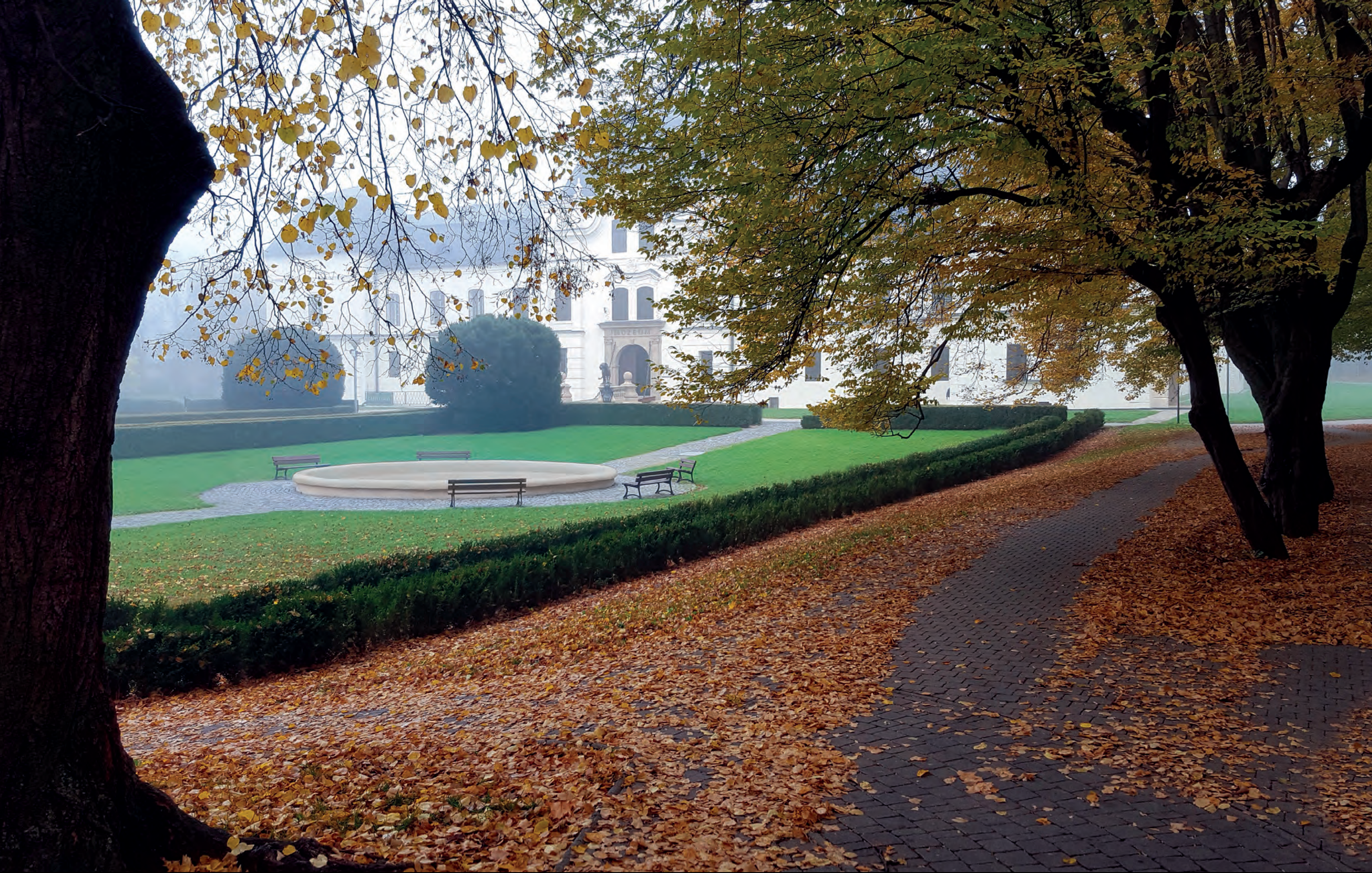
Pohľad na kaštieľ z južnej časti kaštielskeho parku s fontánou, pôvodne s francúzskou parkovou úpravou.