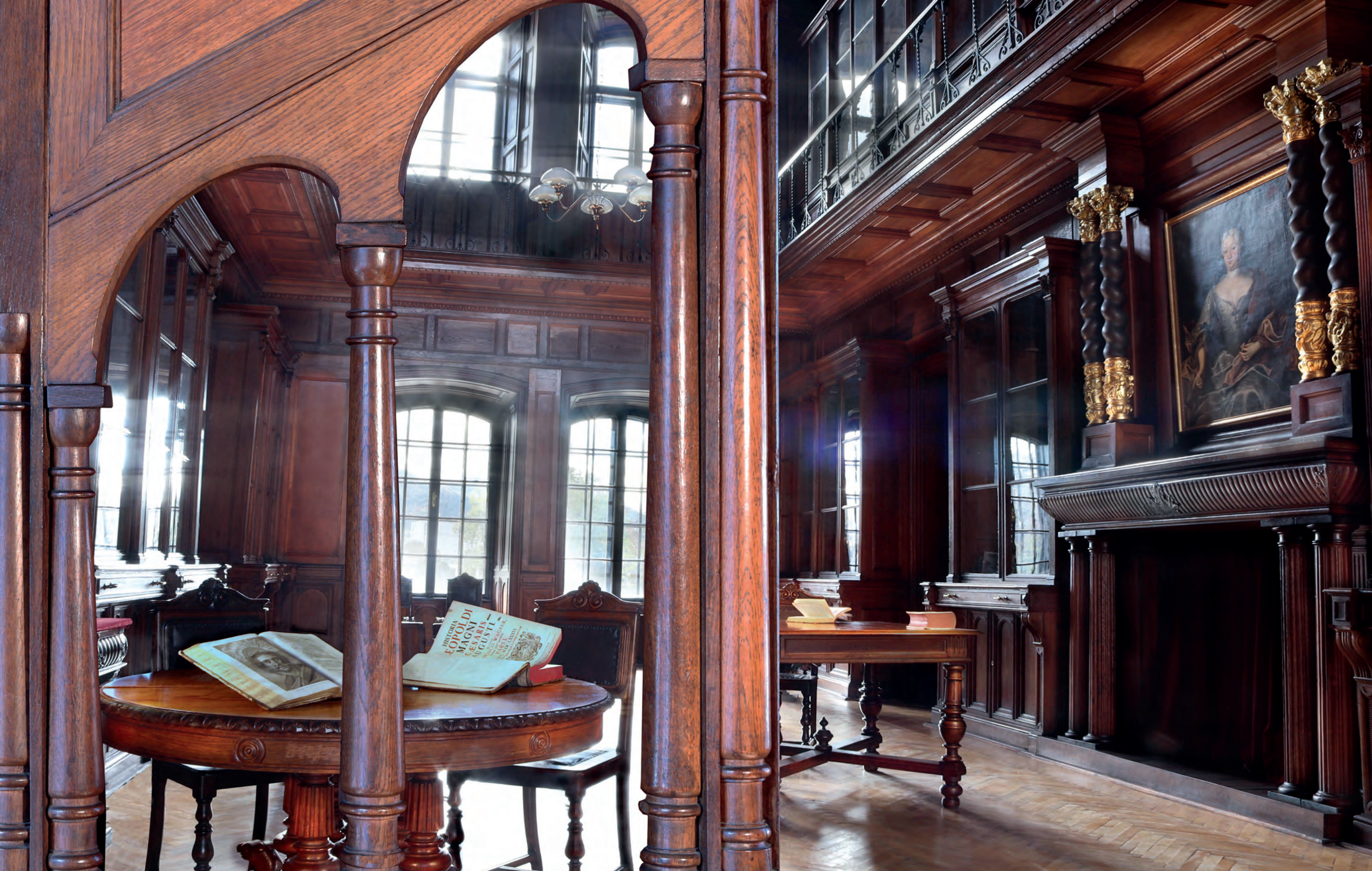
Časť točitého schodiska v dvojetážovej renesančnej knižnici s pôvodným dreveným kazetovým obložením stien a stropu.