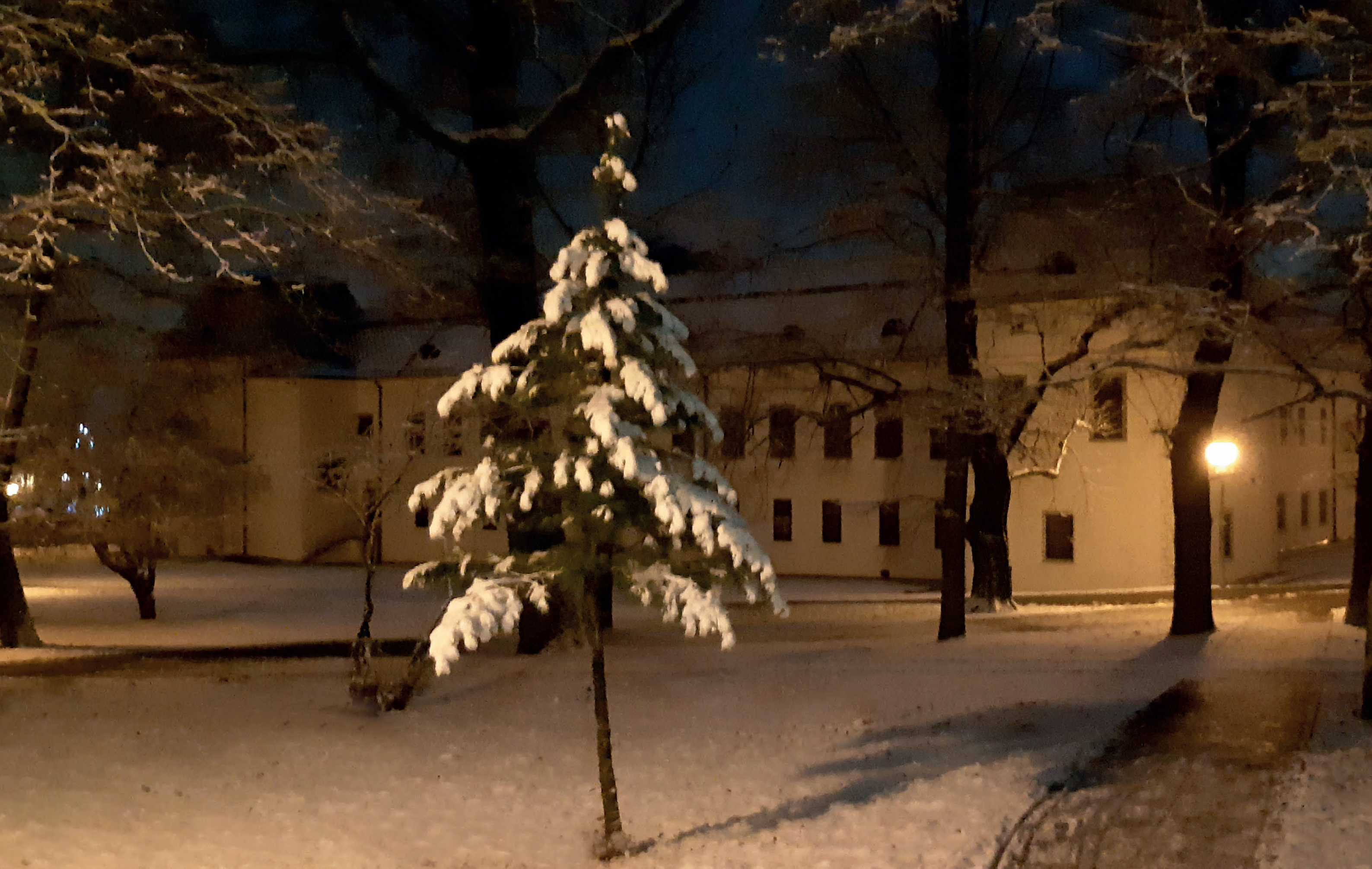
Pohľad na kaštieľ z východnej časti kaštieľskeho parku, pôvodne s anglickou parkovou úpravou.