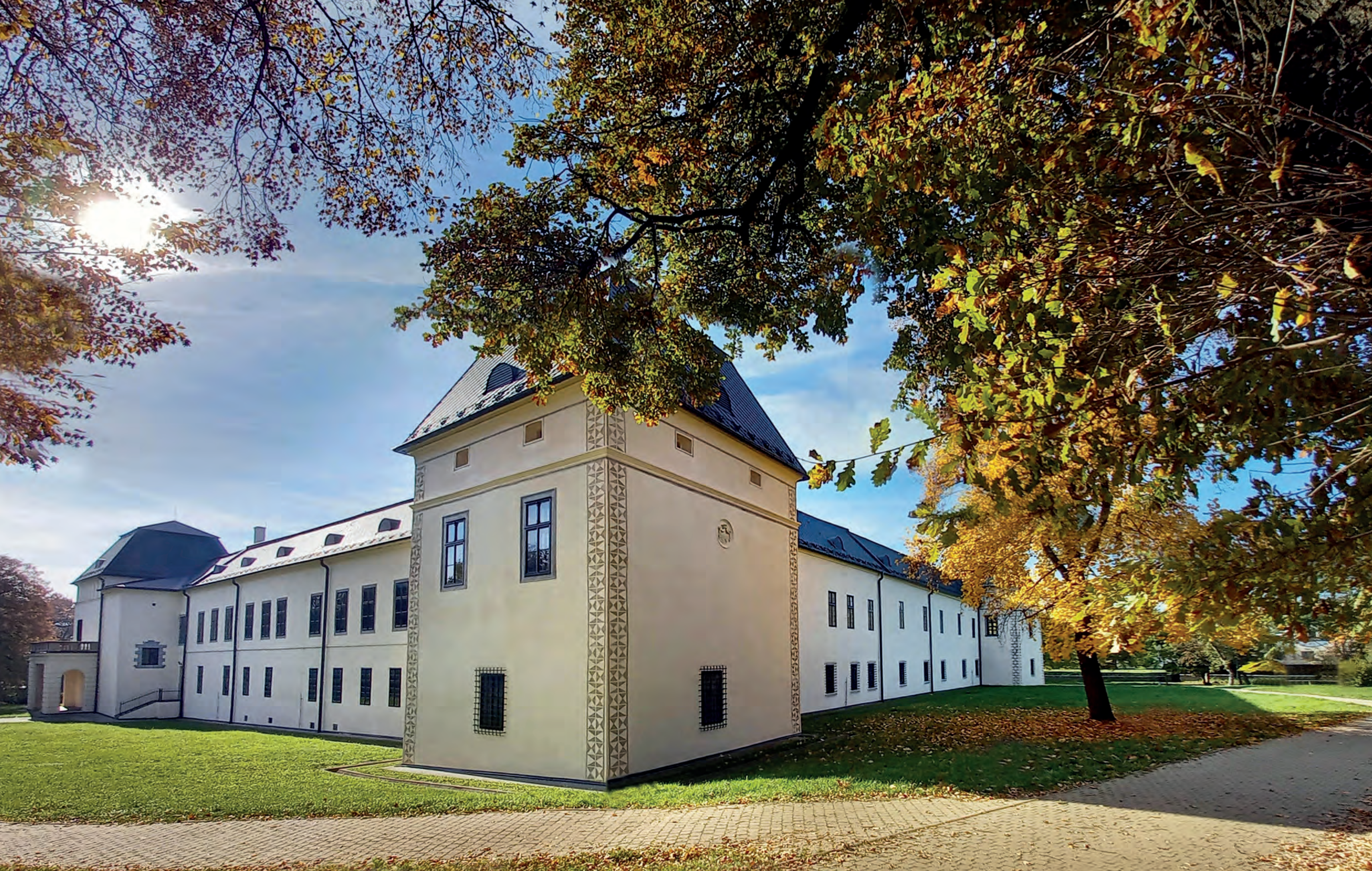
Severovýchodná časť kaštieľa s bastiónmi a malým balustrádovým balkónom.

10 2023 1 | 2 3 4 5 6 7 8 | 9 10 11 12 13 14 15 | 16 17 18 19 20 21 22 | 23 24 25 26 27 28 29 | 30 31