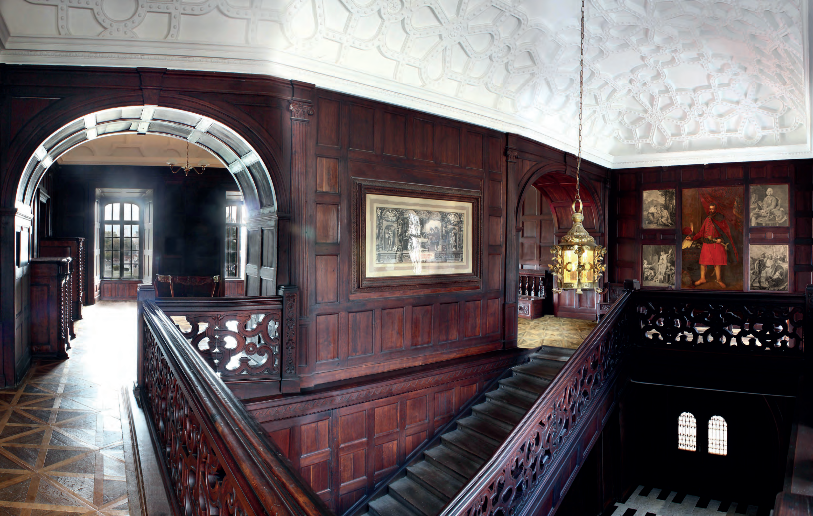
Reprezentačné drevené schodište s neskorobarokovou balustrádou a dominantným portrétom grófa Juraja III. Drugetha (olej na plátne, 18.stor.).