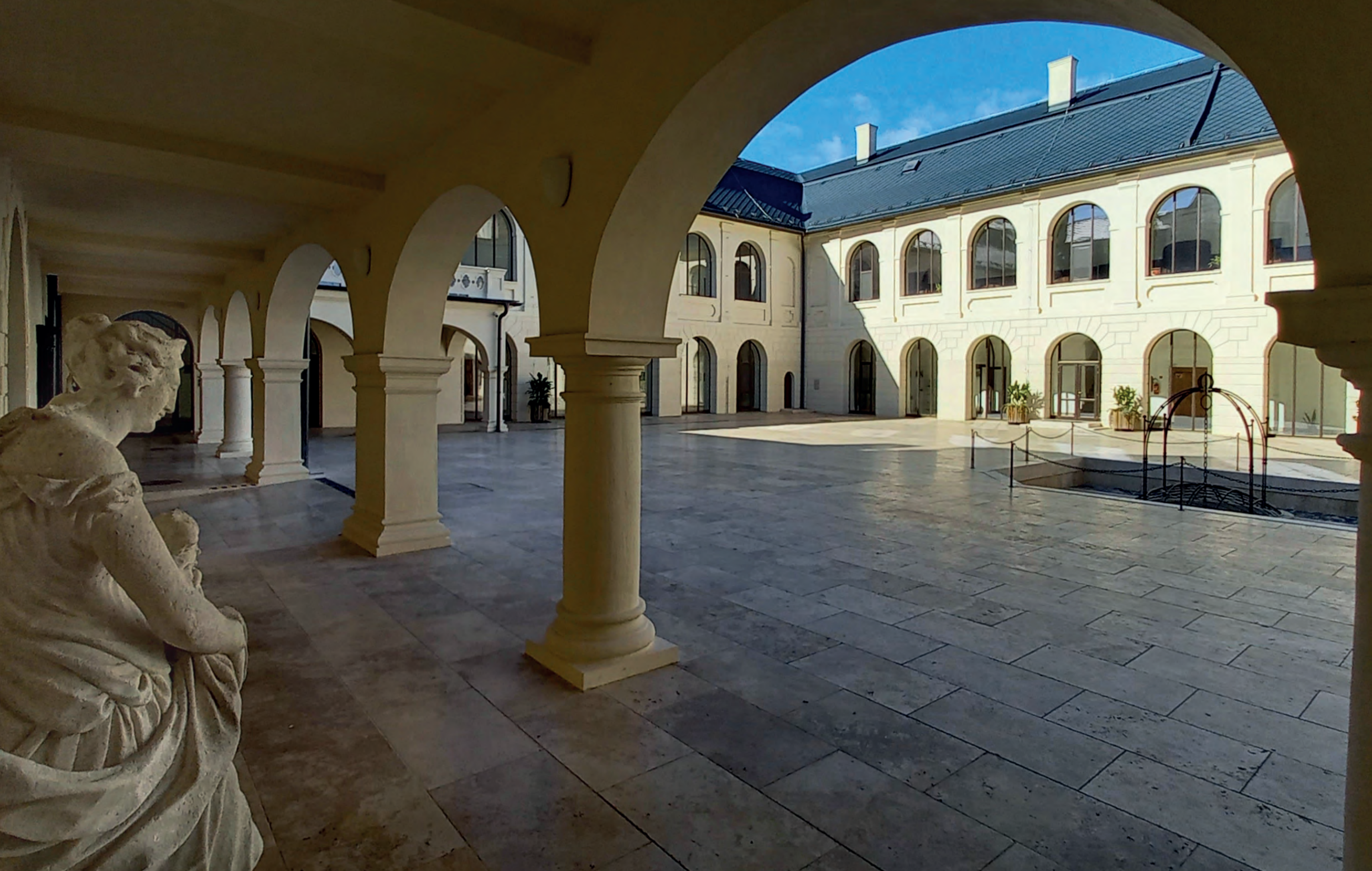
Renesančné nádvorie kaštieľa s arkádovým podlubím a pôvodnou stredovekou studňou (13. stor.).