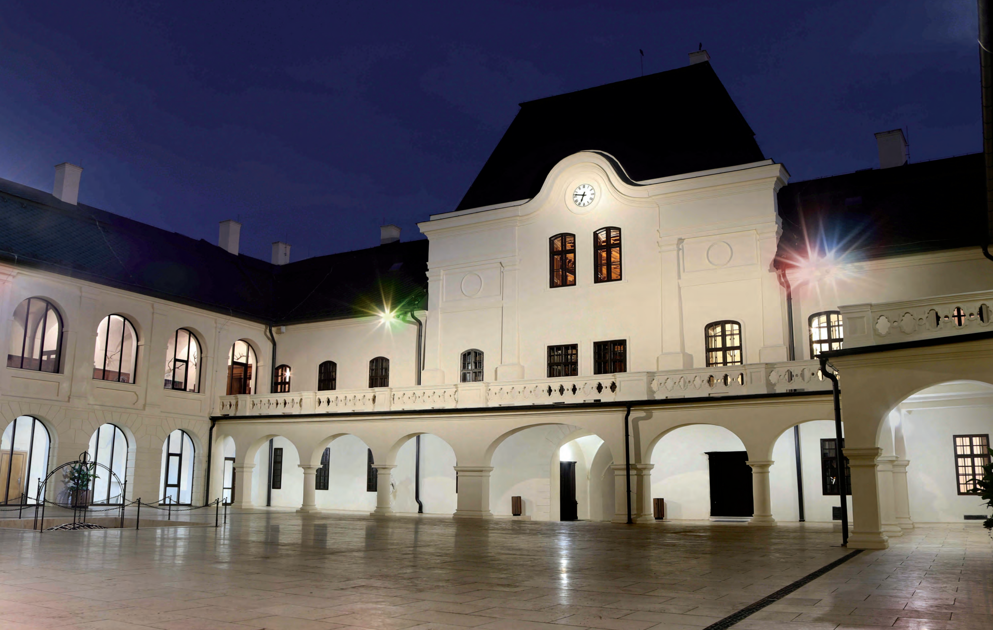
Renesančné nádvorie kaštiela s vnútorným dekoratívnym balustrádovým balkónom a portálnou vežou.

03 2023 1 2 3 4 5 | 6 7 8 9 10 11 12 | 13 14 15 16 17 18 19 | 20 21 22 23 24 25 26 | 27 28 29 30 31